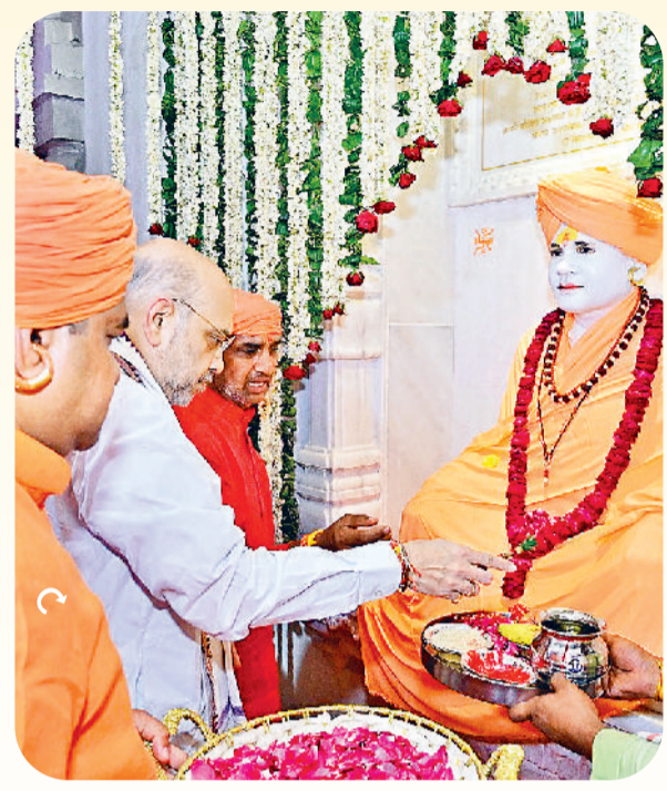
केंद्रीय गृहमंत्री शाह रोहतक पहुंचे