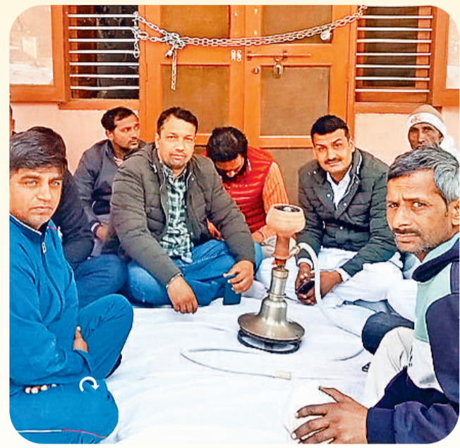
महीनों चला सरपंचों का आंदोलन

रोहतक। जनवरी में प्रदेश सरपंच एसोसिएशन के आह्वान पर सोमवार से जिले में सरपंचों ने ई-टेंडरिंग और राइट टू रि कॉल के विरोध में आंदोलन किया। बीडीपीओ कार्यालय पर ताला भी जड़ा गया। एसडीएम राकेश कुमार को मुख्यमंत्री के नाम ज्ञापन सौंपा गया। सरपंचों ने करीब रोड पर जाम भी लगाया। सरपंचों का कहना था कि सरकार पंचायती राज संस्थाओं को पंगु बनाने में जुटी हुई है। एक के बाद एक संस्थाओं का खत्म करने के निर्णय लिए जा रहे हैं। हाल ही में संस्थाओं को कमजोर करने के लिए फैसला लिया गया कि 2 लाख रुपए से अधिक का कार्य सरपंच नहीं करवाएंगे।